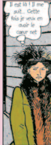
(Tardi, Adèle Blanc-sec )