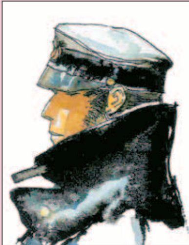
(Hugo Pratt, Corto Maltese )

Sujet d'écriture : Choisir un des personnages de BD et décrire avec précision son physique et son caractère.