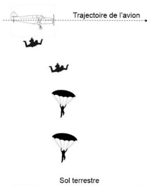
Saut depuis un avion