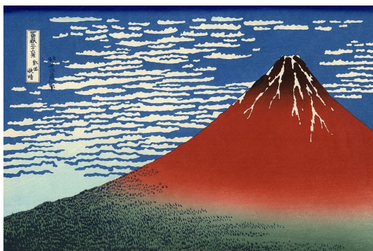
Hokusai, Le Mont Fuji par temps clair .

L'image de gauche est une estampe d'Hokusai, au milieu telle qu'elle est montrée dans le film, à droite telle qu'elle est retraduite dans le cours de l'histoire présentée par Ocelot.