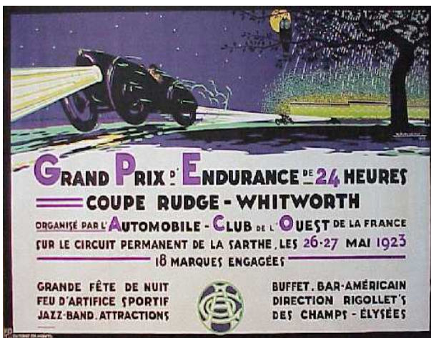
Affiche des 24 heures du Mans auto de 1923