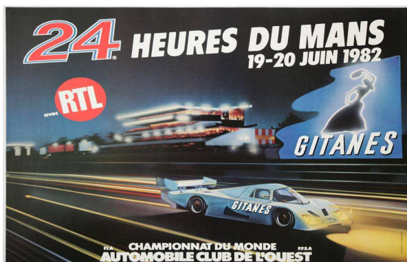
Affiche des 24 heures du Mans auto de 1982 auto de 2006