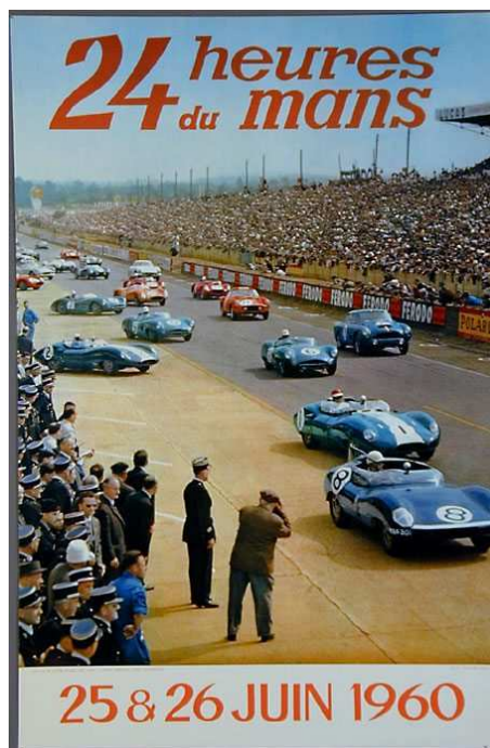
Affiche des 24 heures du Mans auto de 1960