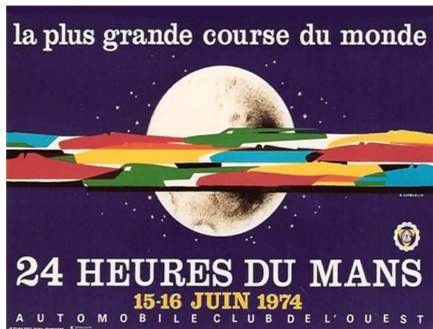
Affiche des 24 heures du Mans auto de 1974