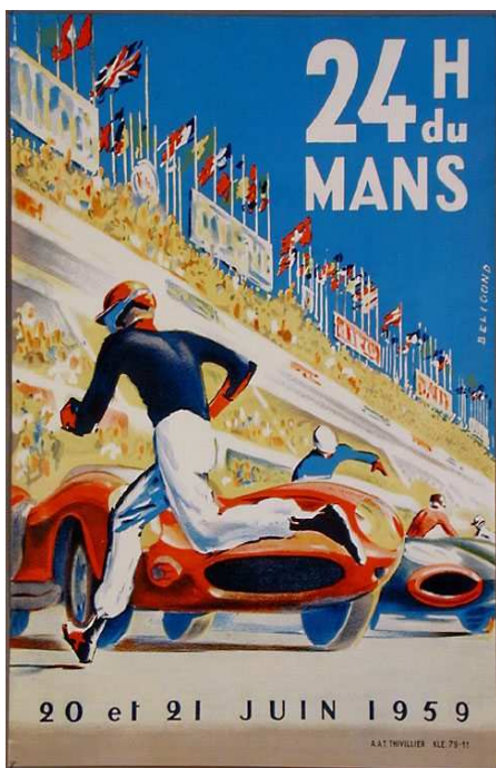
Affiche des 24 heures du Mans auto de 1959