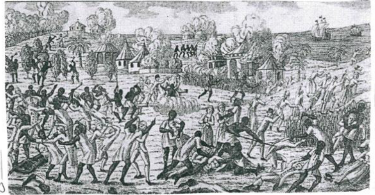
« Représentation de l'idée que, dans la colonie française de Saint-Domingue, gravure, 1791, musée d'Aquitaine, Bordeaux. »

Les esclaves veulent aussi bénéficier des libertés qu'apporte la Révolution aux autres. En août 1791, 15 000 esclaves se révoltent contre leurs maîtres à Saint-Domingue. Grâce à la rébellion certaines personnes comme Levasseur et Lacroix (députés) ont réussi à abolir l'esclavage par la Convention.