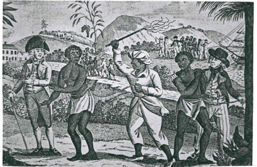
Les violences faites aux esclaves manuel histoire géographique 4 ème

Plantation : Exploitation agricole dans laquelle travaillent et vivent des esclaves sous l'autorité d'un propriétaire.