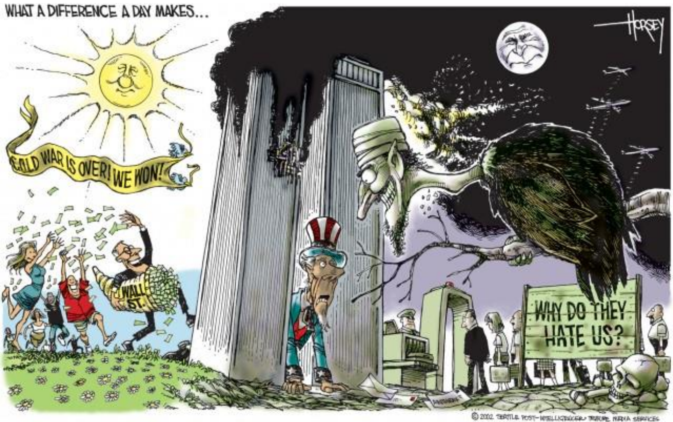
Dessin du caricaturiste américain David Horsey, sur le site Seattle Pi, posté le 8 septembre 2011.

Quelques éléments de traduction : « What a difference a day makes... » : La différence faite en un seul jour ... « Cold war is over, we won ! » : la guerre froide est terminée, nous avons gagné ! « Why do they hate us ? » : Pourquoi nous haïssent-ils ?