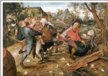
Bruegel Rixe paysanne XVIè

Après avoir bien observé ces 10 tableaux, choisis avec les camarades de ton groupe quatre tableaux et essayez de reproduire une partie du tableau pour traduire la position des corps et les émotions exprimées dans une mise en scène chorégraphiée composée d'un début , des quatre reproductions des tableaux, de liaisons entre ces tableaux, et d'une fin.