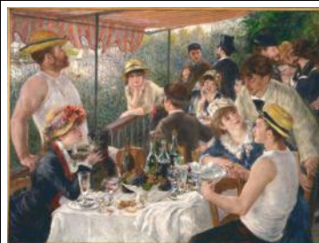
Auguste Renoir Le déjeuner des canotiers 1880