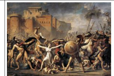
J.L David Les Sabines arrêtant le combat entre les Romains et les Sabins 1799