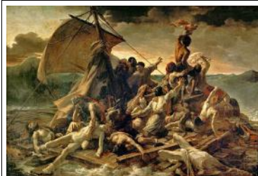
Théodore Géricault Le radeau de la méduse 1817-1819