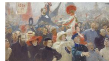
Ilya Répine La manifestation du 17 octobre 1905