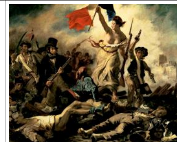
Eugène Delacroix La liberté guidant le peuple 1830