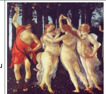
Sandro Botticelli Le printemps 148