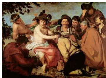
Diego Velázquez Le triomphe de Bacchus 1628