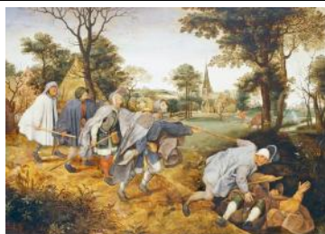
Pieter Bruegel Les aveugles 1568