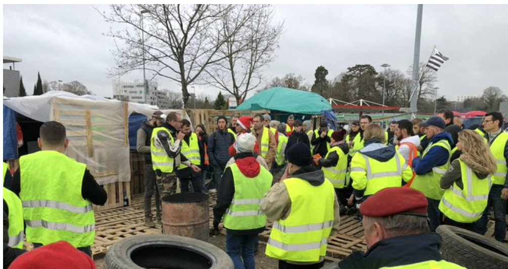
OUEST FRANCE, 8 décembre 2018