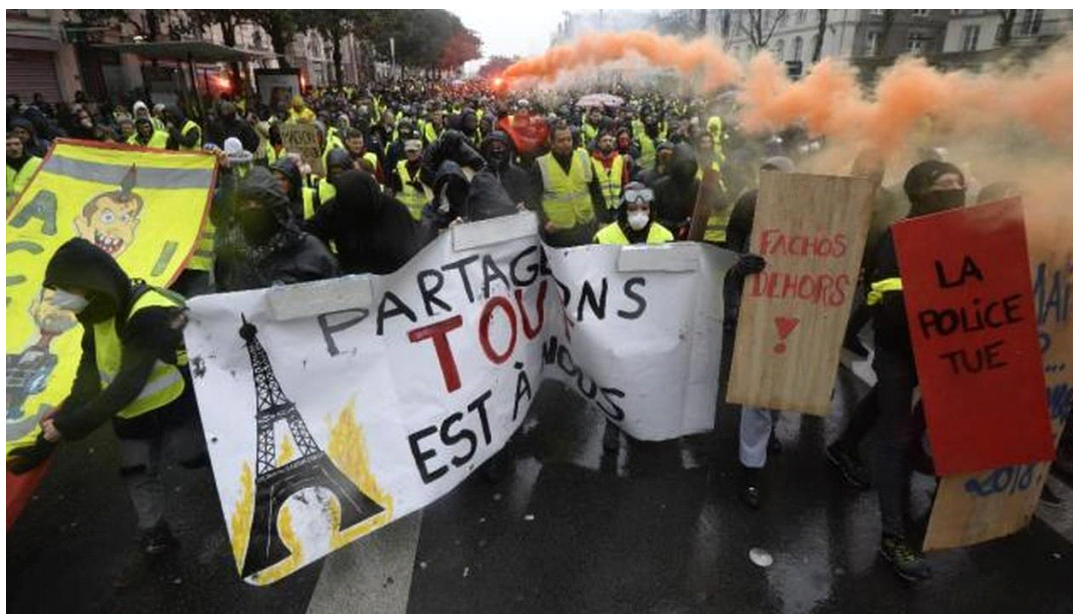
OUEST FRANCE , 8 décembre 2018