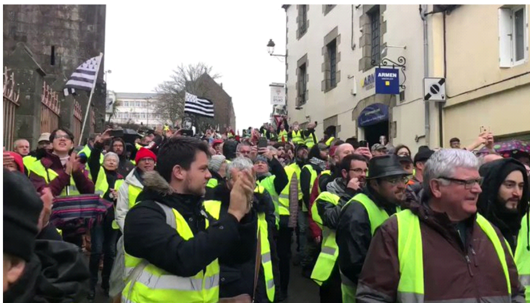
OUEST FRANCE, 8 décembre 2018