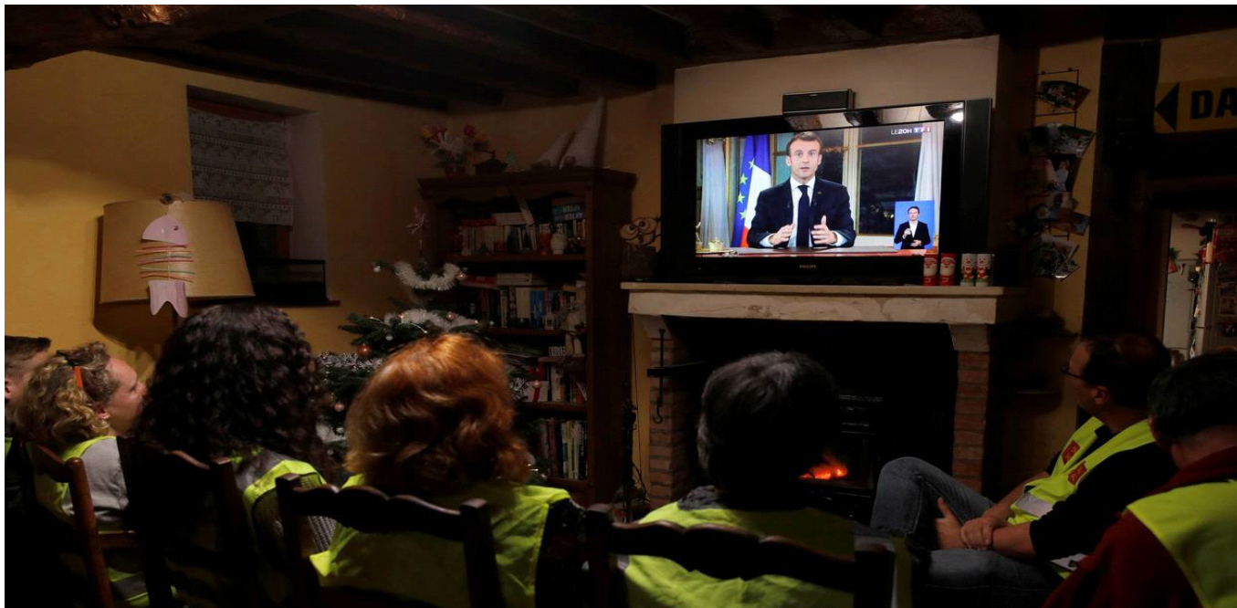
Ouest France, le 11 décembre 2018