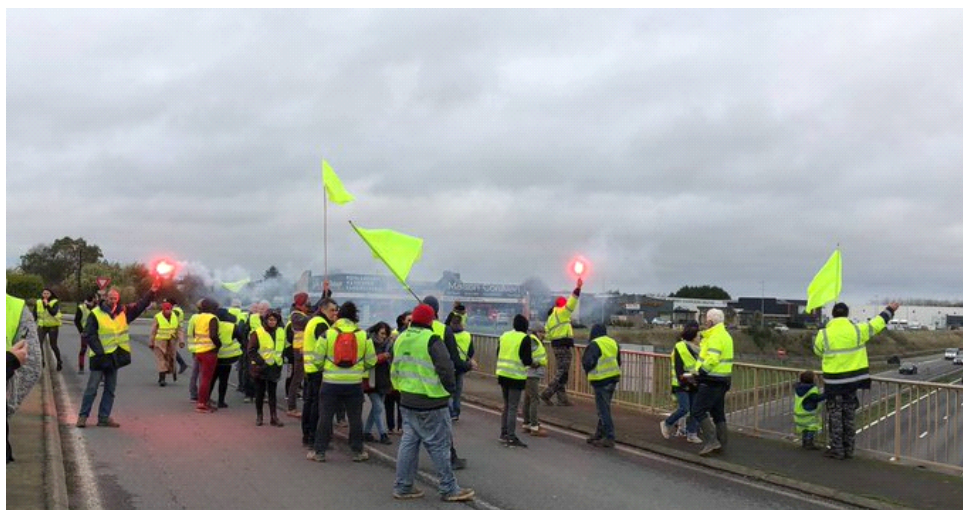
OUEST FRANCE , 8 décembre 2018