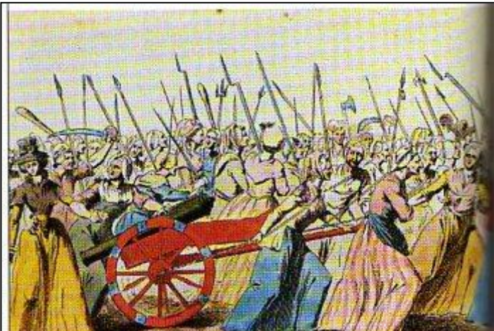
Le départ des femmes pour Versailles (gravure du XVIII e siècle. Musée Carnavalet, Paris.)

Ce terme désigne les habitants de Paris partisans des Montagnards. Socialement, ils se recrutent parmi les boutiquiers, artisans, compagnons. Sensibles aux difficultés d'approvisionnement, à la hausse des prix, d'où la présence importante des femmes parmi ceux-ci, ils réclament la taxation des produits alimentaires. Les sans-culottes pratiquent le tutoiement égalitaire, s'adressent les uns les autres en s'appelant citoyens, portent un costume caractéristique : pantalon et non culotte pour les hommes, jupes tricolores pour les femmes, chemise, veste courte (la carmagnole), se coiffent d'un bonnet phrygien, porte en permanence sabre et pique. Ils participent activement aux journées révolutionnaires de 1792 et 1793 et ils forment les effectifs des armées révolutionnaires qui sillonnent la France.