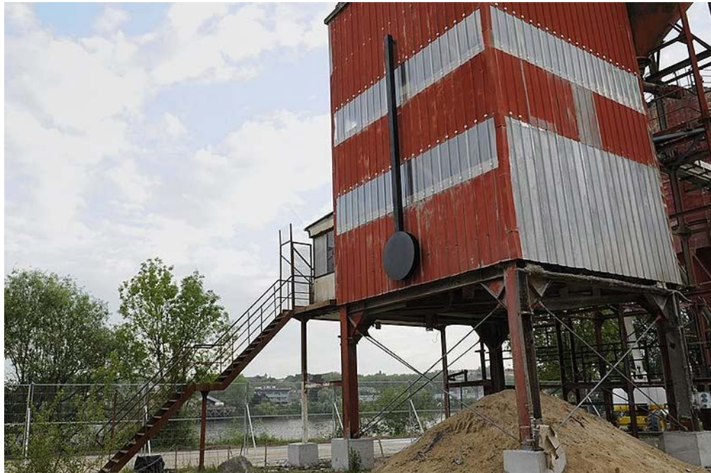
Le pendule Roman Signer Trentemoult