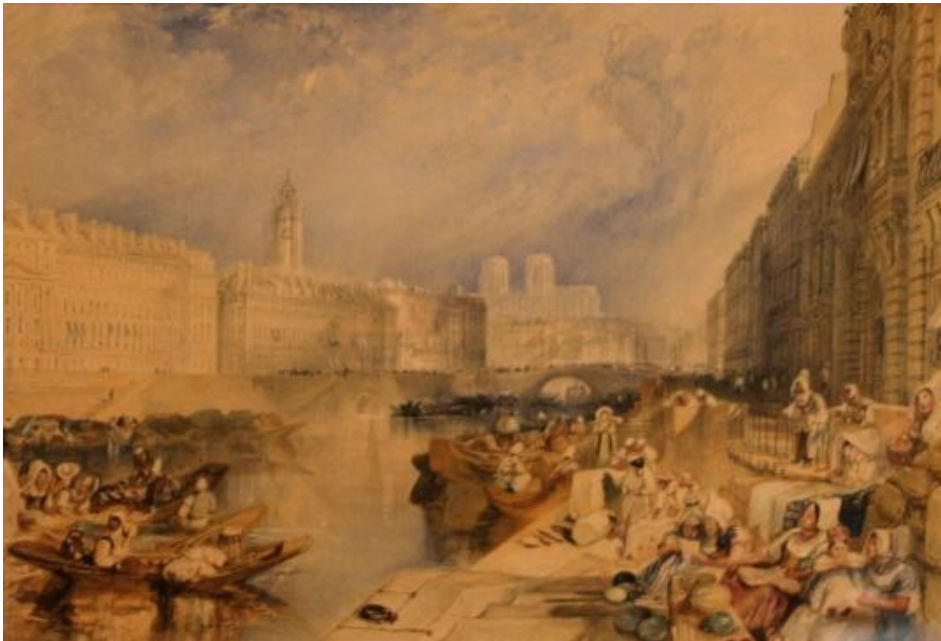
Nantes - William Turner - 1829 - château des Ducs

comment le paysage s'est inscrit peu à peu dans l'histoire de la peinture