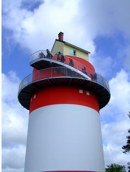
Villa Cheminée, œuvre de Tatzu Nishi Bouée / Cordemais

La Biennale d'art contemporain « Estuaire » inscrit des œuvres pérennes sur un territoire, l'estuaire de Nantes à Saint -Nazaire.