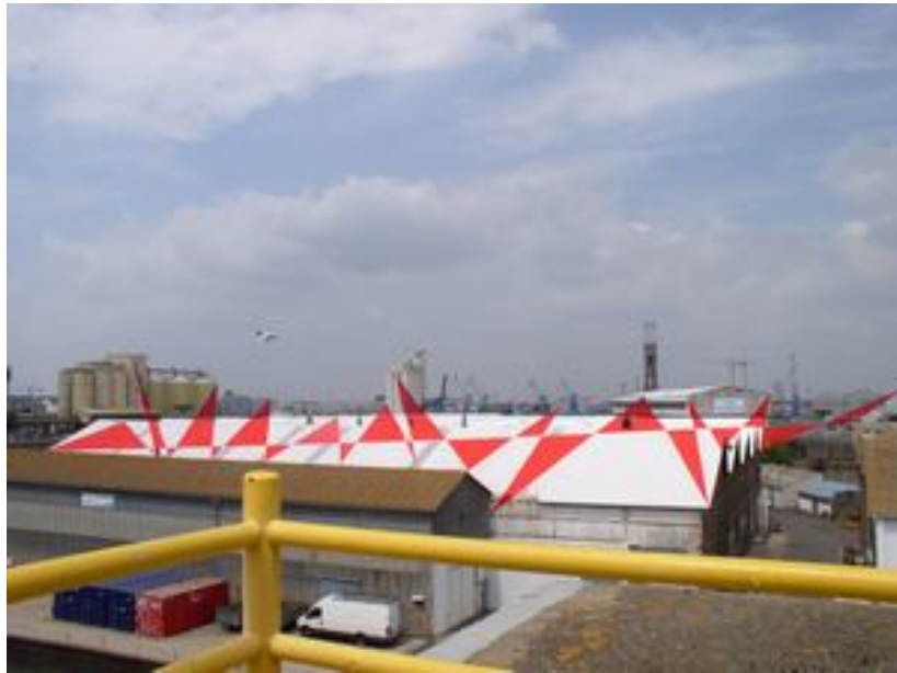
Suite de triangles – Felice Varini – Saint Nazaire