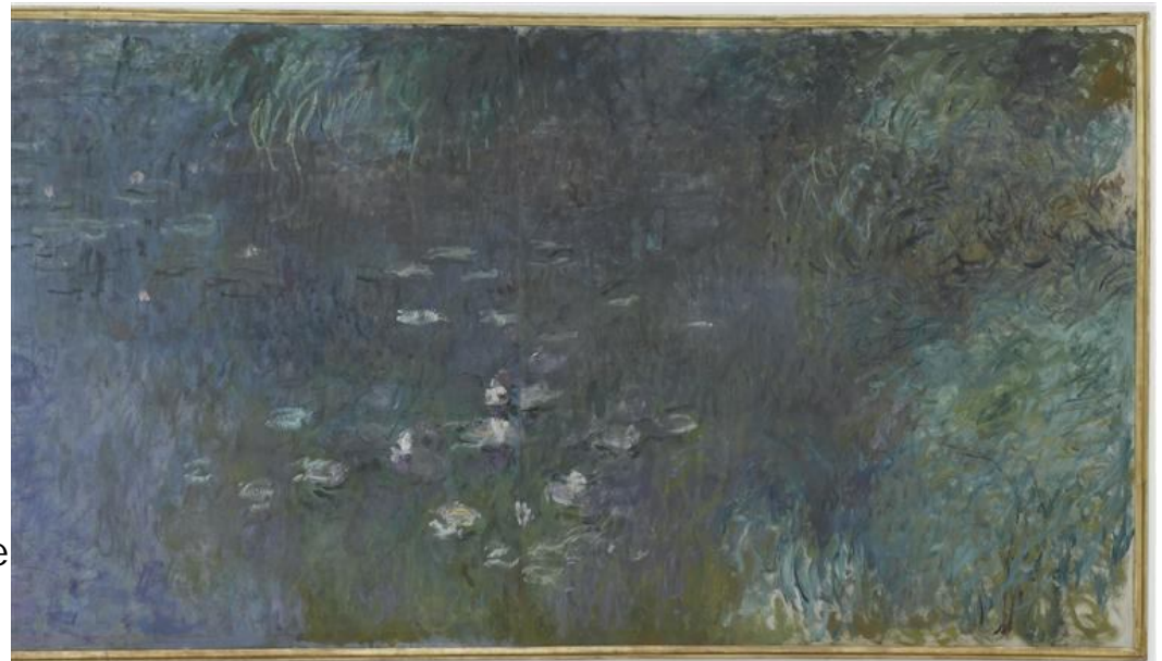
Les Nymphéas : Matin (détail) – Claude Monet – 1922 – Musée de l'Orangerie

comment les artistes, sortant de l'atelier à la fin du 19 ème siècle, se sont mis à l'intérieur du paysage pour ressentir, voir, traduire le paysage et le transformer dans leurs tableaux.