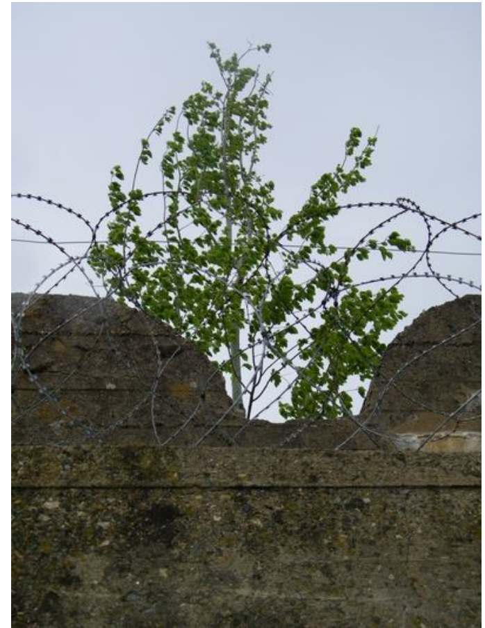
Le Jardin du Tiers-Paysage – Gilles Clément Toit de la base sous-marine – Saint Nazaire