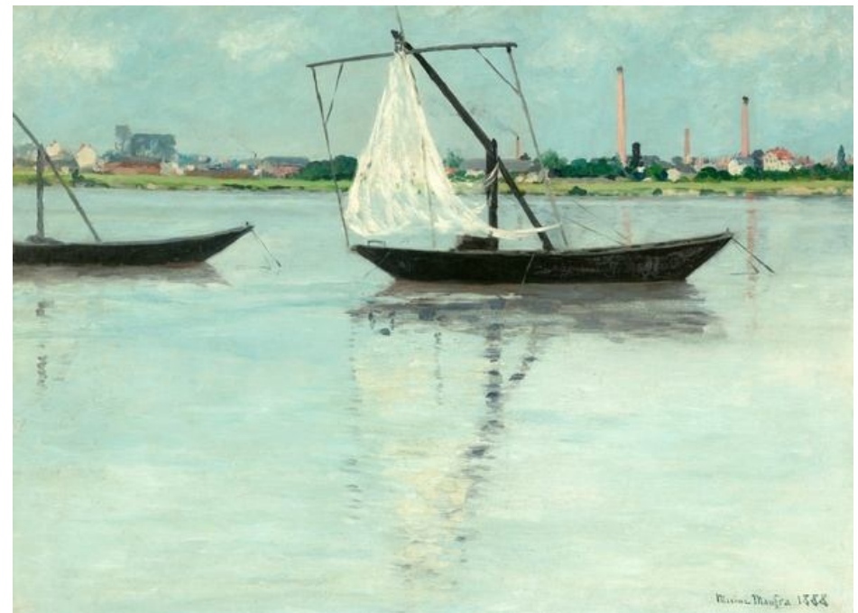
La prairie d'amont - Maxime Maufra - 1888 - MBA Nantes