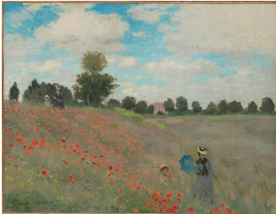
Coquelicots – Claude Monet – 1873 – Musée d'Orsay

comment les artistes, sortant de l'atelier à la fin du 19 ème siècle, se sont mis à l'intérieur du paysage pour ressentir, voir, traduire le paysage et le transformer dans leurs tableaux.