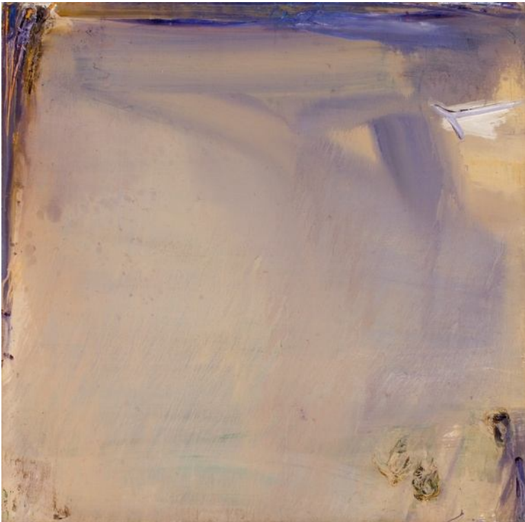
Ocre Violet Loire