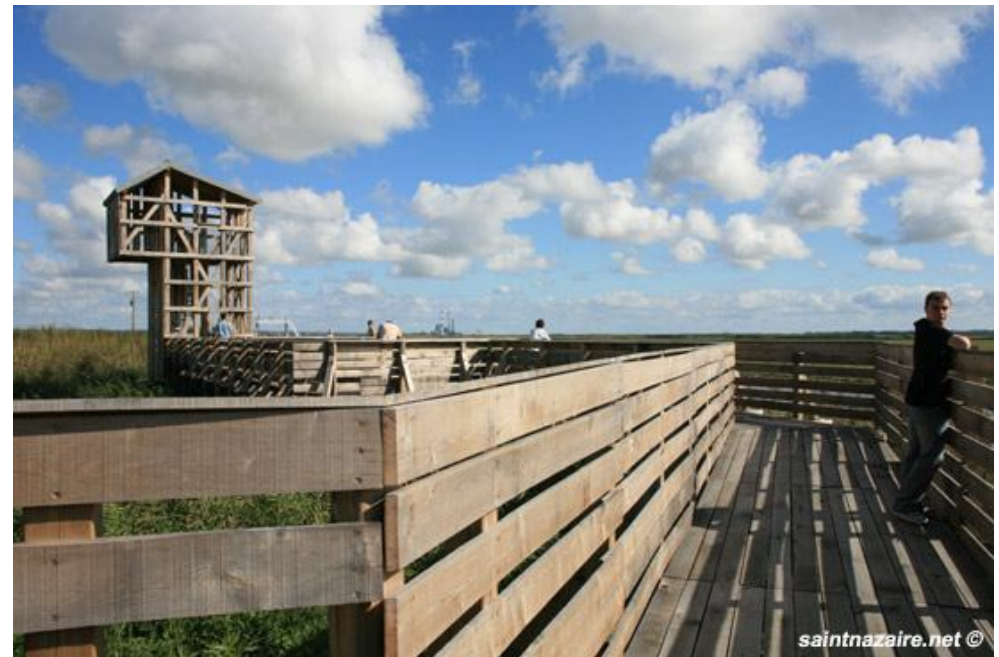
L'Observatoire - Tadashi Kawamata - Lavau sur Loire