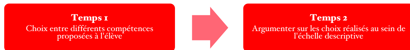
Tab 10 : Exemple d'outil à disposition de l'élève lors du temps 1