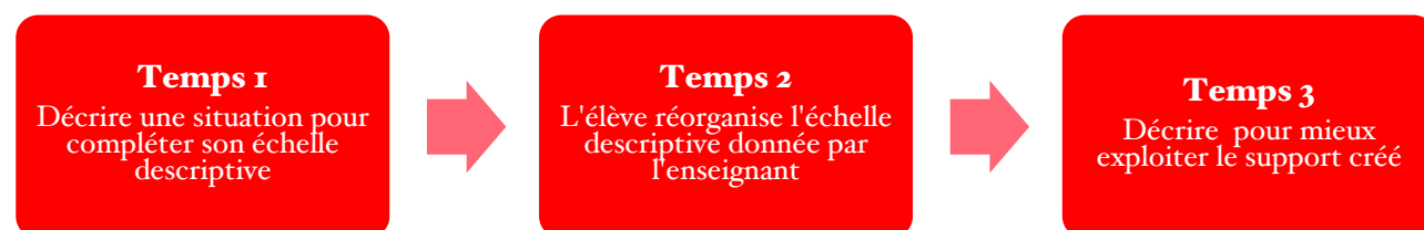
Tab 5 : Travailler l'enjeu de formation « décrire » à travers les outils de suivi

Un deuxième travail, temps 3, (Tab.5) peut être proposé aux élèves. Celui-ci décrit l'échelle descriptive créée par l'élève, l'amenant à expliquer et faire comprendre à un camarade ou à l'enseignant la forme et le contenu de ce support construit. L'échelle descriptive dans le cadre de ce deuxième travail est un support de communication. S'exprimer avec une diction claire, ne pas oublier des éléments essentiels du propos ou encore formuler son propos avec fluidité sont des compétences mobilisées par les élèves lors de la présentation orale, lors de la description de cette échelle à un camarade ou à l'enseignant.