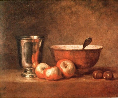
Jean Siméon Baptiste Chardin