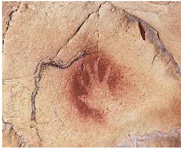
La main de Chauve - préhistoire