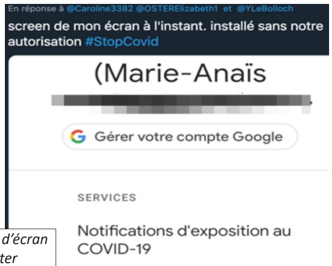
Captures d'écran Twitter

Mais ces apparitions n'ont rien à voir avec l'application StopCovid développée par le gouvernement français.