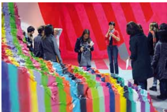
Visite de l'exposition Elsa Tomkowiak, 2012