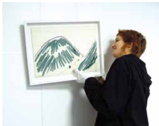
Montage de l'exposition Jean-Michel Sanejouand

Le Frac propose des expositions de sa collection dans les collèges et lycées. Elles sont conçues autour d'un thème (le portrait, l'écriture, le temps...) qui permet d'aborder différentes notions du programme et convoque une multiplicité de pratiques (dessins, photographies, peintures, vidéos). Découvrant les œuvres de leur temps, les élèves s'initient par ailleurs, avec l'aide d'un médiateur et d'un régisseur du Frac, à la scénographie, au montage et à la médiation. Ils bénéficient, par cette expérience, d'un rapport privilégié et quotidien à l'œuvre.