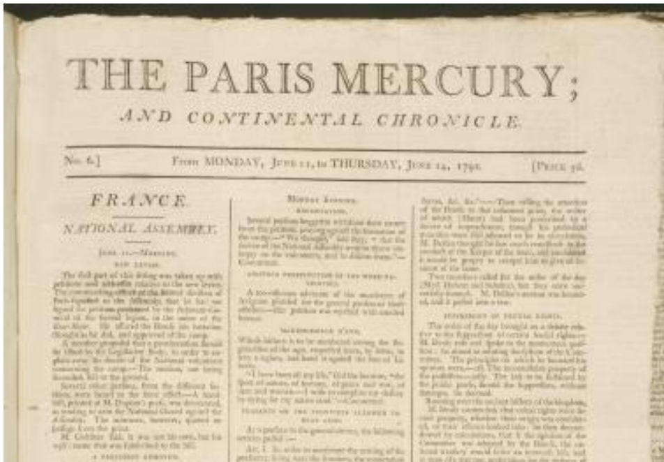
Document 1 : La une d'un journal vendu en Grande Bretagne, paru la semaine du 14 juin 1792

Pratiquer différents langages (écrire pour construire sa pensée)