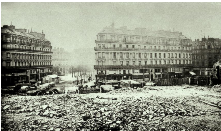
Avenue de l'Opéra, 1864, Photographie de Charles Malville .

Andriveau-Goujon, Eugène (1832-1897). Plan d'ensemble des travaux de Paris à l'échelle de 0,001 pour 10 mètres (1/10 000) indiquant les voies exécutées et projetées de 1851 à 1868, 1868.