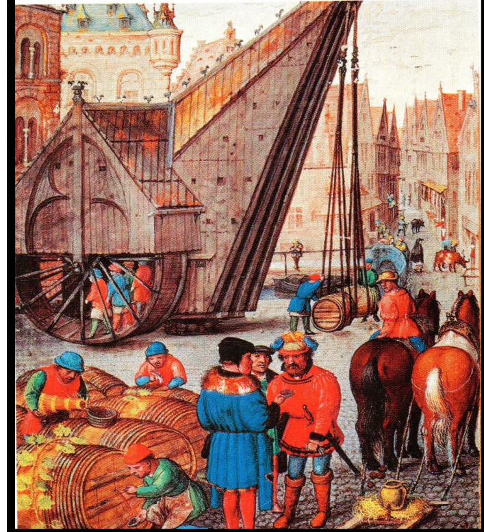
Le commerce du vin à Bruges. Enluminure, Simon Benning, XVIème siècle .

Bruges est une grande ville, très riche, et l'un des principaux marchés au monde. [...]. On trouve ici des produits d'Angleterre, d'Allemagne, du Brabant, de Hollande, de Zélande, de Bourgogne, de Picardie et d'une bonne partie de la France.