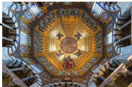
Intérieur de la coupole. La mosaïque ornant la coupole a été refaite au 19 e siècle mais représente comme au 9 e siècle un Christ en majesté.