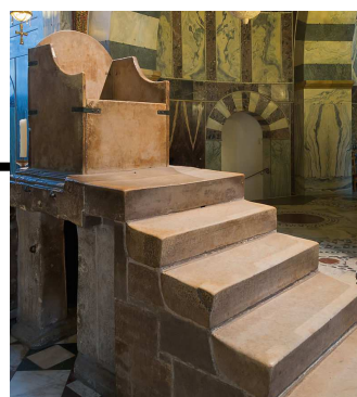
Le trône de Charlemagne, installé dans la tribune du 1 er étage permettait à l'empereur d'assister aux cérémonies. L'autel de Saint-Pierre dont le pape est considéré comme le successeur se trouvait en bas, faisant face au trône de Charlemagne.