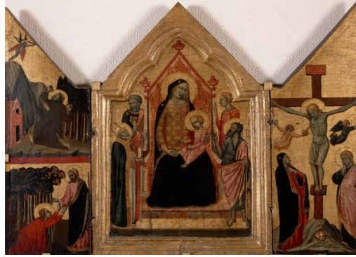
La Vierge en majesté entourée de saints ; Saint François d'Assise recevant les stigmates ; Jésus-Christ et la Madeleine

1330 Tryptique Peinture sur bois 35 x 23 cm