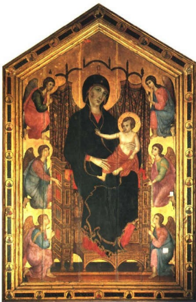
DUCCIO DI BONINSEGNA, Maesta (Madone Rucellai), 1285 environ, détrempe sur bois, 450 x 293 cm.