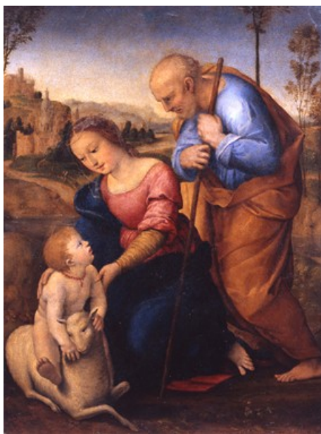
Raffaello Sanzio dit RAPHAEL (atelier de) La Sainte Famille à l'agneau ou La Madone à l'agneau, Vers 1504 Huile sur bois 0.29x0.21 m

Quelles évolutions importantes, en terme de représentation de paysage, remarques-tu d'un tableau à l'autre ?