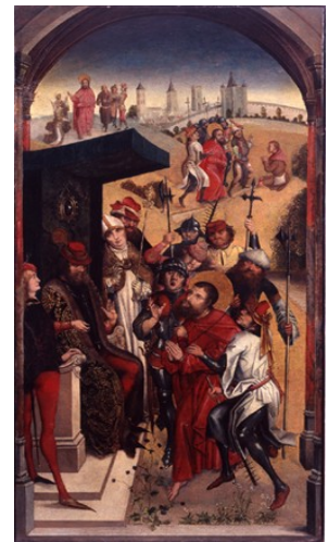
Maître à la Vue de Sainte Gudule Le Christ devant Pilate, vers 1490 Huile sur bois, 0.92x 1.049 m

1330 Tryptique Peinture sur bois 35 x 23 cm