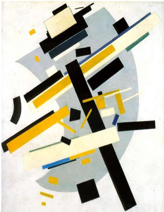
Kazimir Malevitch (1878-1935)

dans toutes les civilisations, la relation qu'entretient l'homme avec le monde s'illustre par la manière dont il conçoit et représente l'espace. Qu'elle ait une origine cosmogonique, symbolique, poétique, ou qu'elle semble découler d'une approche rationnelle du réel et des phénomènes optiques, la représentation de l'espace repose nécessairement sur un système qui produit des équivalents plastiques. On observera que le dessin génère également son propre espace, son propre système, qu'il migre d'un support à l'autre, révèle ce support ou parvient à s'en dégager.