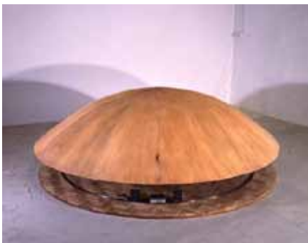
Patrice Carré 3,14116 variable , 1988 œuvre de la collection du Frac des Pays de la Loire

Grave et facétieuse à la fois, l'ensemble de l'œuvre de Richard Baquié joue avec les lieux communs et les poncifs, récupère, mêle, détourne les matériaux, les objets et les mots, leurs formes, leur propriété et leur sens. Utilisant à plein l'association, l'assemblage, le collage, il renouvelle ici le corps de la passion, qui pulse au rythme de l'eau parcourant ses veines de plastique. Courant fluide, circulation en boucle, l'installation s'obsède de cette répétition vitale, dans le ressassement circulaire du temps : une sorte de marmite bricolée et animée d'un moteur gère les flux, et comme un cœur, émet des sons. Le caractère organique et vivant de l'œuvre confirme sa puissance poétique : quoi de plus viscéral que la passion, quoi de plus humain aussi ?