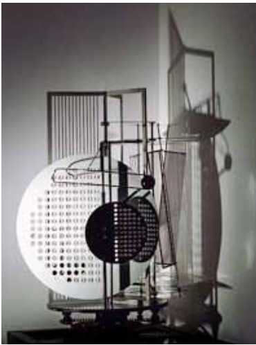
László Moholy-Nagy Le Modulateur-espace- lumière , 1930

Les premières œuvres présentées ci-dessous permettent un ancrage historique.