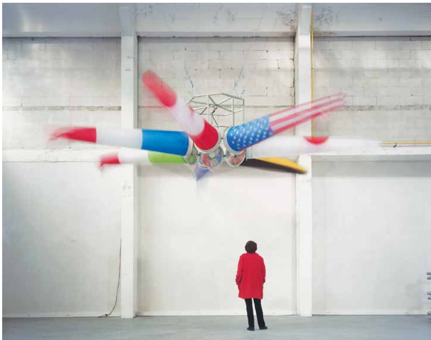
Lilian Bourgeat, G7 , 1996 - œuvre de la collection du Frac des Pays de la Loire

Dans le cadre de sa mission de sensibilisation des publics à la création contemporaine et de formation des publics enseignants, le Frac des Pays de la Loire propose une approche d'œuvres - pour la plupart issues de sa collection - autour de la thématique :