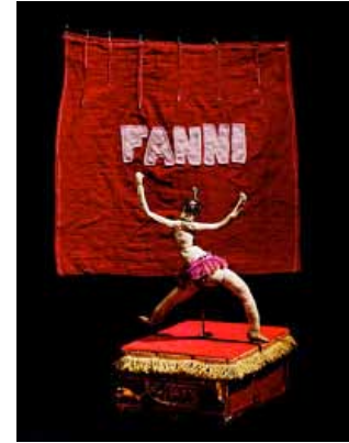
Alexandre Calder Cirque Calder , 1926-1931

Premier chef-d'œuvre de Calder, Le Cirque est également une expérience centrale dans son œuvre : il s'inscrit dans la continuité de ses dessins réalisés à New York à partir de l'observation du mouvement des animaux et annonce, avec sa mise en mouvement d'objets à trois dimensions, les futurs mobiles.