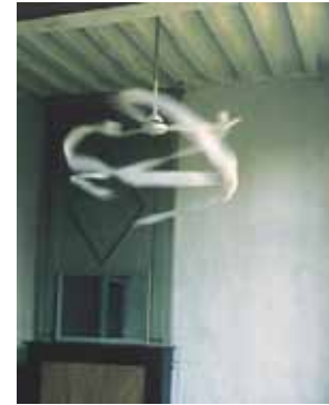
Gabriel Orozco Ventilator , 1997 œuvre de la collection du Frac des Pays de la Loire

Chez Patrice Carré ou Rebecca Horn, la notion de mouvement induit également les notions de temporalité, de répétition. -----