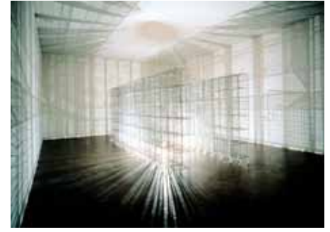
Mona Hatoum Light Sentence , 1992 Le Frac possède une autre œuvre de Mona Hatoum : A Couple (of Swings) , 1993

Inspiré du dispositif traditionnel des ombres chinoises, le Théâtre d'ombres apparaît dans l'œuvre de Christian Boltanski dès 1984, succédant aux grandes formes découpées des Compositions théâtrales (1980). L'ombre et sa projection associées au thème des marionnettes suggèrent de nombreuses évocations issues de toutes les cultures et mythologies - le Golem, la Kabbale, la caverne platonicienne, le récit des origines de la peinture chez les Grecs par le tracé des contours d'une ombre, la danse des morts des Mystères du Moyen Âge, l'impression photographique. Cette ouverture du sens, propre aux œuvres de Christian Boltanski, n'entame toutefois pas la dimension onirique et ludique de ce théâtre de marionnettes qui, en fonction des lieux dans lesquels il est dressé, s'anime selon une configuration à chaque fois renouvelée.