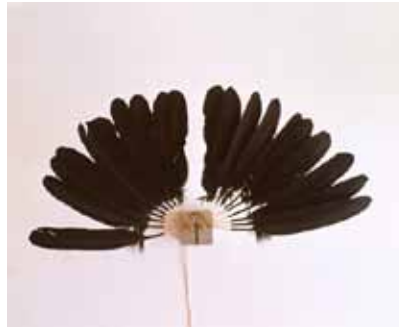
Rebecca Horn La petite veuve , 1988 œuvre de la collection du Frac des Pays de la Loire

"Dans mon travail, il y a constamment cette idée de décalage, de rupture d'échelle : l'énorme structure qui vient comme chapeauter quelque chose de tout petit, le train miniature qui ballade le son, la combinaison du mouvement giratoire va provoquer une réaction physique du son qui va s'échapper en enflant et en diminuant. (...) Le dôme en bois et le parquet renvoient bien sûr à l'architecture, une architecture sonore."