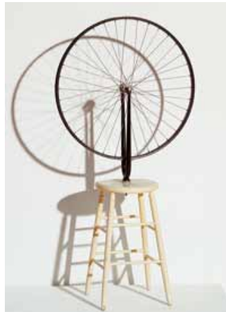
Marcel Duchamp La Roue de bicyclette , 1913/1964

Moholy-Nagy fait la conception de cette première œuvre cinétique en 1922, mais ne la produit qu'en 1930, avec l'aide de l'ingénieur Stefan Sebök. Le Modulateur-espace-lumière devient le sujet abstrait d'un de ses films Jeu de lumière: noir-blanc-gris en 1930. L'artiste désignait sa sculpture comme la description de la transparence en action.