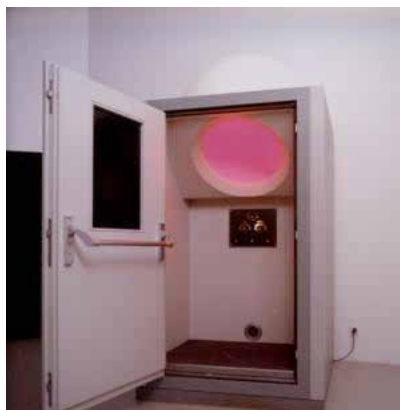
James Turrell Perceptual Cell , 1991

d'optique que les différentes couleurs produisent dans l'angle d'une pièce. Cette installation doit, en effet, être disposée en coin, pour adoucir ou accentuer les lignes architecturales, c'est-à-dire modifier les caractéristiques d'un espace défini. Comme le dit Donald Judd à propos du travail de cet artiste, Flavin crée « des états visuels particuliers », des perceptions singulières qui rassemblent, dans la fragilité de la lumière, couleur, structure et espace. Avec ses œuvres, Flavin accomplit parfaitement la mission de l'Art minimal telle que Judd la définit dans « Specific objects », faire en sorte que l'objet se confonde avec les trois dimensions de l'espace réel. Grâce au recours à la lumière, Dan Flavin irradie l'espace, comme contaminé par la beauté et la spiritualité de l'œuvre. Le contexte devient son contenu.