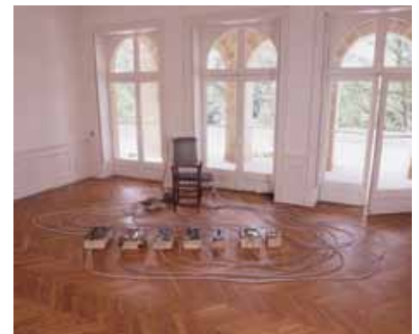
Richard Baquier Passion oubliée , 1984 œuvre de la collection du Frac des Pays de la Loire

L'œuvre n'est plus conçue comme une forme statique, mais comme un champ traversé par un flux d'énergie. À l'objet clairement délimité dans l'espace se substitue un continuum en développement qui envahit l'espace environnant et se déploie dans le temps. C'est à ce mode de représentation que Light Sentence , 1992, de Mona Hatoum en appelle : dans un espace vide, au milieu d'une construction de casiers métalliques ajourés, une ampoule nue, actionnée par un moteur, monte et descend, projetant l'ombre mouvante des casiers sur les murs. Toutes les composantes du cinéma sont réunies, mais agencées différemment ; et comme dans l'expérience du cinéma, le visiteur perçoit le mouvement comme un principe de séparation entre l'ombre et la clarté.