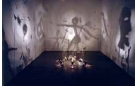
Christian Boltanski Le Théâtre d'ombres , 1986 Le Frac possède une autre œuvre de Christian Boltanski : Composition féerique , 1979

technologie. L'utilisation du mouvement dans la sculpture est alors un retour sur l'homme, les artistes utilisant des matériaux de récupération, bricolés, petites mécaniques du réel. -----