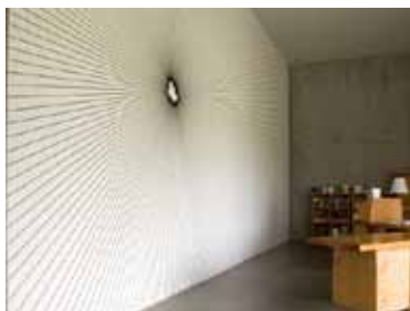
Jérôme Poret Sonik drawing, 2006

«Dans mes recherches sur une nouvelle façon de penser le phénomène sonore, j'ai réfléchi sur le rapport à l'écriture, ainsi qu'à la manière d'inscrire une fréquence. A Shanghai, j'ai été plutôt séduit par des trames trouvées dans un magasin : les speedlines sont des décalcomanies utilisées pour la réalisation des mangas, elles permettent de simuler/stimuler de manière graphique et optique le déplacement d'énergie, la vitesse, les coups, l'élan. J'ai relu des mangas comme Akira ou Gunm et je me suis concentré sur ces représentations graphiques de fluctuation d'énergie. J'ai repris les détails miniatures, je les ai agrandis : à une certaine échelle, une vibration très forte commence à apparaître, créant une densité. La densité est une espèce de quatrième dimension du son, outre sa profondeur et son existence dans l'espace-temps. C'est un phénomène que l'on retrouve avec la lumière. Le son se nourrit de sa propre densité. Selon l'endroit où le son se déplace, la densité sera plus ou moins importante. J'ai donc eu envie de créer une tablature graphique de ce que j'ai nommé les «Sonik's drawings».