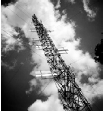
Nicolas Schöffer Tour de Liège , 1961

La Tour est une sculpture abstraite de 52 mètres de haut. Elle est composée d'une ossature portant des bras parallèles et de 64 plaques-miroir de formes et de dimensions différentes qui sont fixées sur 33 axes tournants. Chaque axe est entraîné par un moteur dont les vitesses sont variables. L'ensemble du dispositif est relié à un système électronique d'information et de mise en action constante. Des appareils tels que des microphones pour les bruits, des cellules photo-électriques pour la lumière, des prises thermiques et hygrométriques, des anémomètres envoyaient des informations à un cerveau électronique. Ce dernier déclenchait, en réaction, des combinaisons variées de mouvements, sons et lumières. L'enregistrement sur cinq bandes de différentes séquences musicales (percussions et bruits urbains retravaillés électroniquement) permettait la sonorisation de la Tour. Certaines parties de ces cinq séquences étaient superposées et provoquaient ainsi un déroulement sonore imprévu. La nuit, 120 spots multicolores, commandés également par le cerveau, éclairaient les pales miroirs qui renvoyaient la lumière.