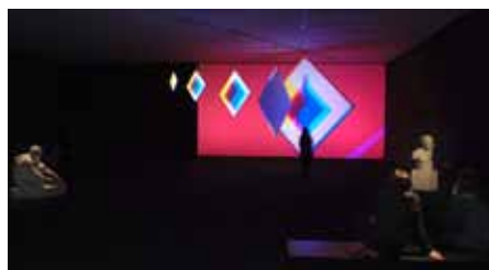
Brian Eno Quiet Club out # 13, 2005

Transmission (2008) est constituée de deux baies de sonorisation reliées entre elles par une centaine de câbles longs de plusieurs mètres venant en quelque sorte compenser, par leur matérialité invasive et chaotique, l'immatérialité d'un son qui plus est absent. En effet, si la présence d'un contenu sonore ne fait ici aucun doute - l'appareil émetteur indique la lecture d'un CD tandis que l'appareil récepteur signale les modulations sonores au moyen de diodes lumineuses en mouvement -, celui-ci est tu, étouffé, réduit à un simple flux symboliquement spatialisé par les câbles, matériau que l'on pourrait qualifier de fil conducteur de l'œuvre de Dominique Blais tant il s'y trouve présent. Posé sur un coffrage blanc greffé à l'un des murs de l'espace, c'est précisément un câble électrique, dont une section est constituée d'un néon éclairant à lui seul toute la pièce, qui compose cette œuvre issue de la série « Les Cordes », initiée en 2007. « Libérant » métaphoriquement l'énergie électrique contenue dans le câble au moyen du néon lumineux, elle s'impose comme un contrepoint visuel à l'œuvre qu'elle côtoie - Transmission - qui, au contraire, « emprisonne » le son.