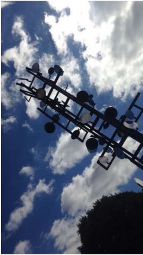
Soraya : J'ai porté un regard inhabituel sur « Chronos 8 » en choisissant un angle de vue en contre-plongée et diagonal, et en associant le ciel, l'arbre et l'oeuvre.