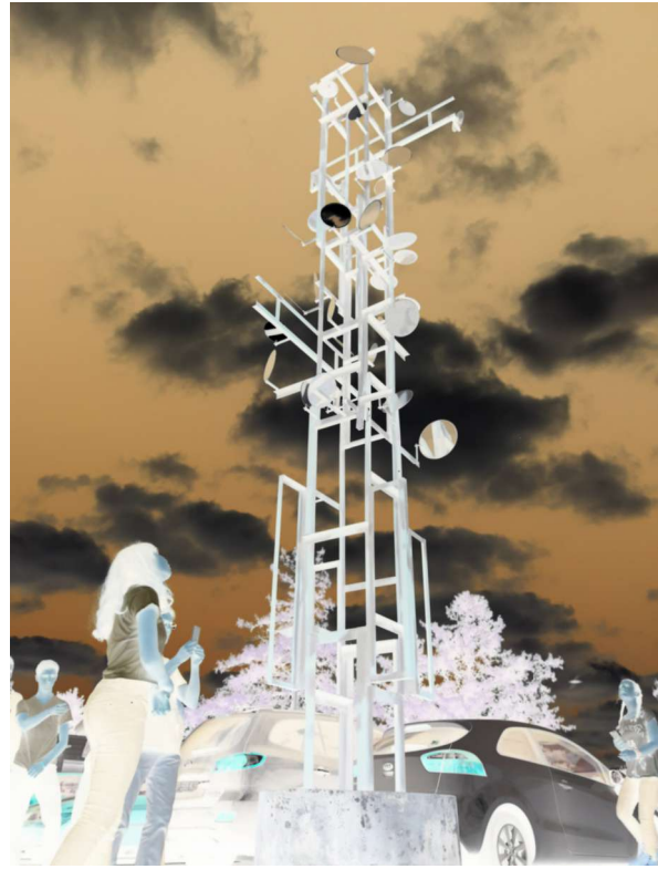
Bilal : J'ai porté un regard inhabituel sur « Chronos 8 » en choisissant de prendre un filtre négatif et une prise de vue en contre-plongée.