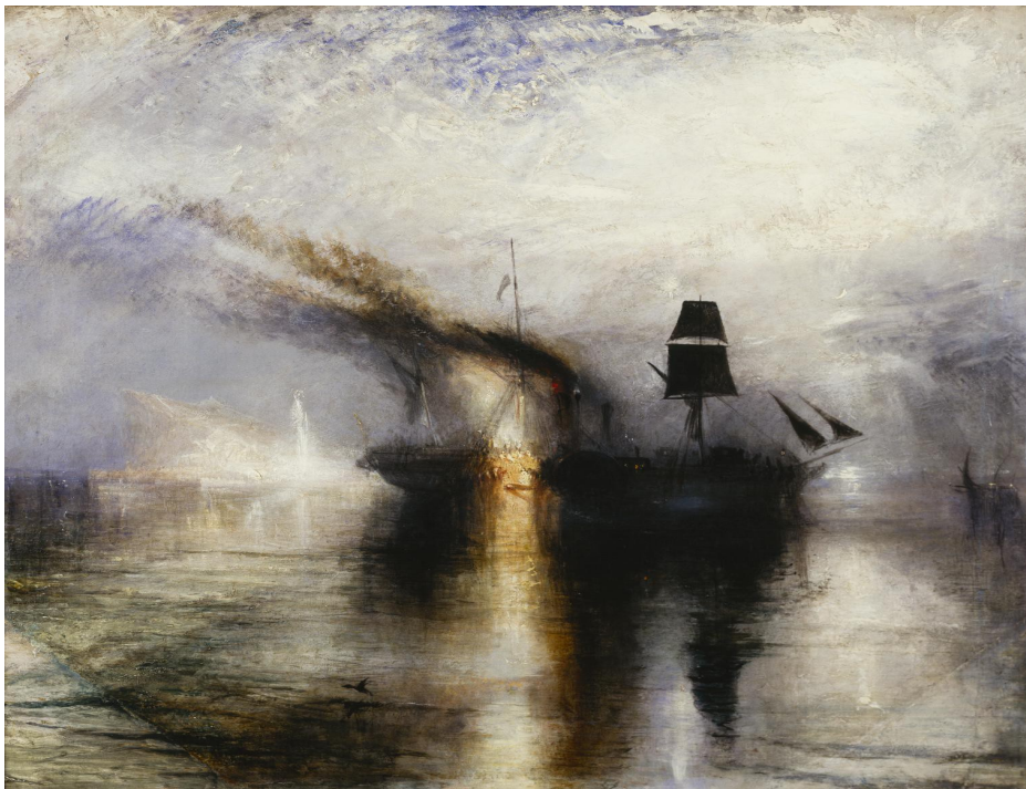
Peace – Burial at Sea Oil paint on canvas 870 x 867 mm 1842