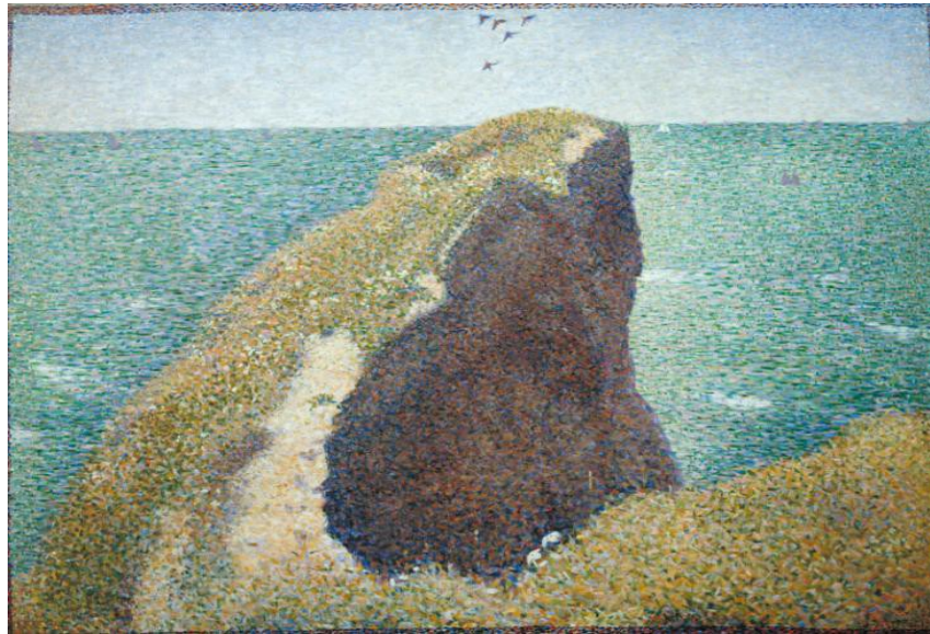
Le Bec du Hoc, Grandcamp