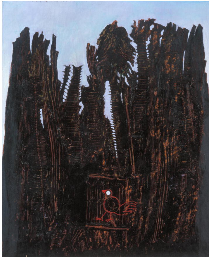
Forest and dove Oil paint on canvas 1003 x 813 mm 1927