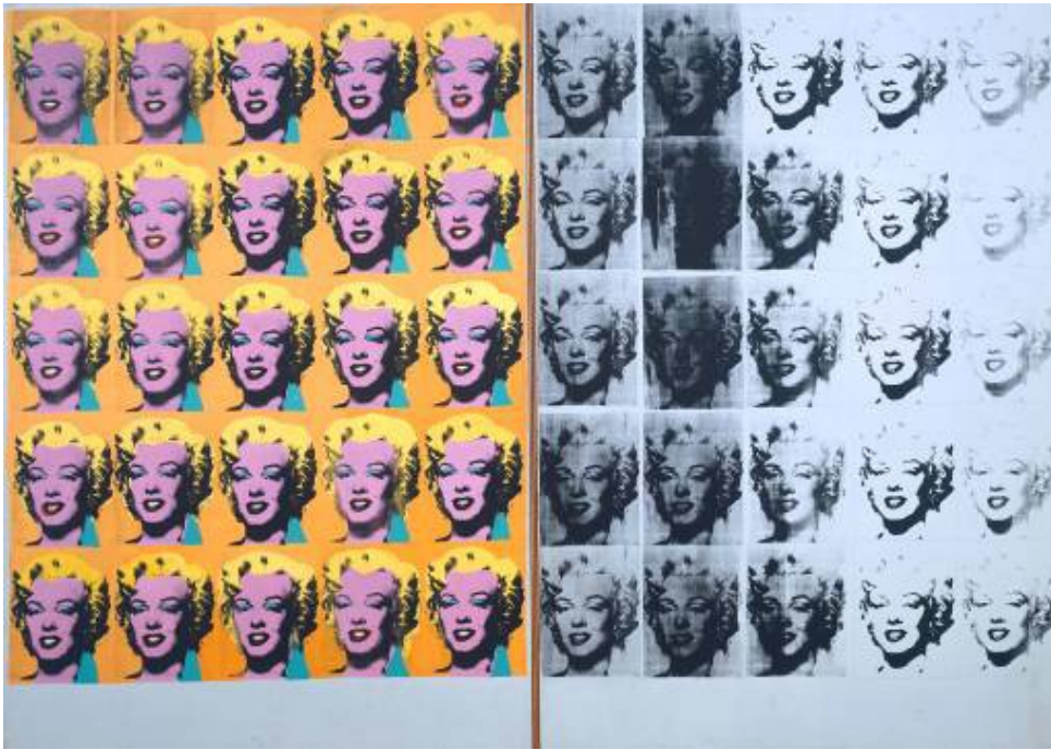
Marilyn diptyque 2054 × 1448 mm Acrylic paint on canvas sérigraphie 1962