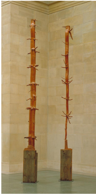
Tree of 12 metres Wood 6000 x 500 x 500 mm 1980-1982