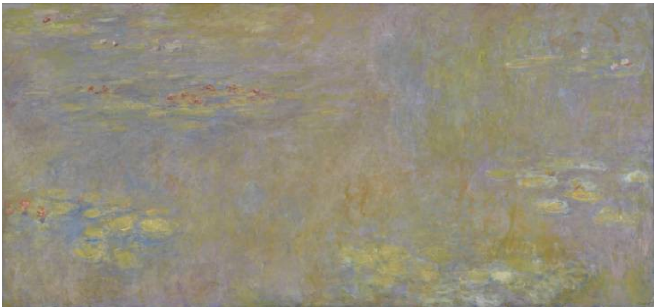
Water-lilies Oil paint on canvas 2007 x 4267 mm after 1916