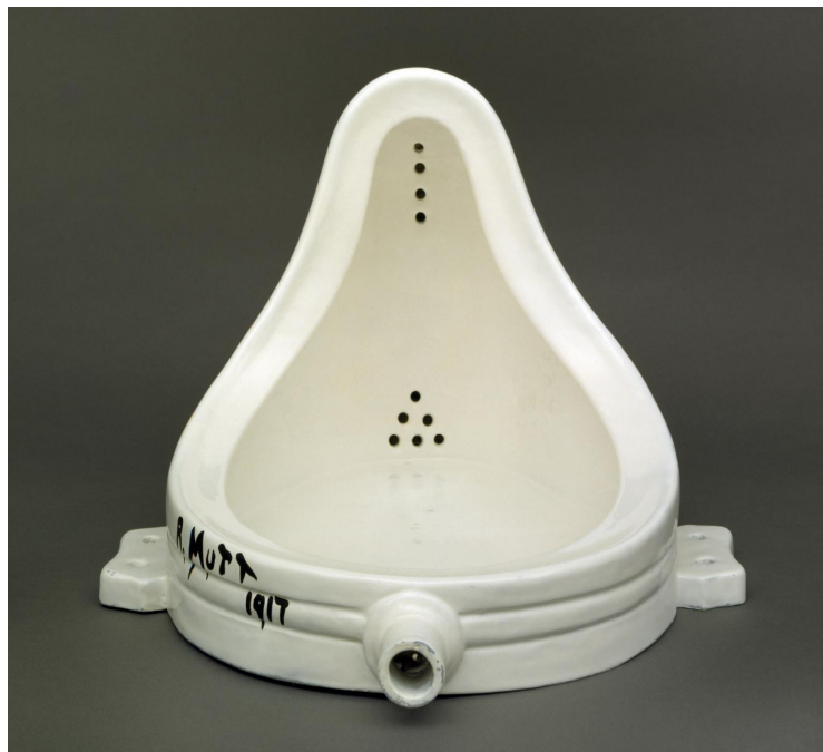
Fountain ready-made 360 x 480 x 610 mm Porcelain 1917, replica 1964