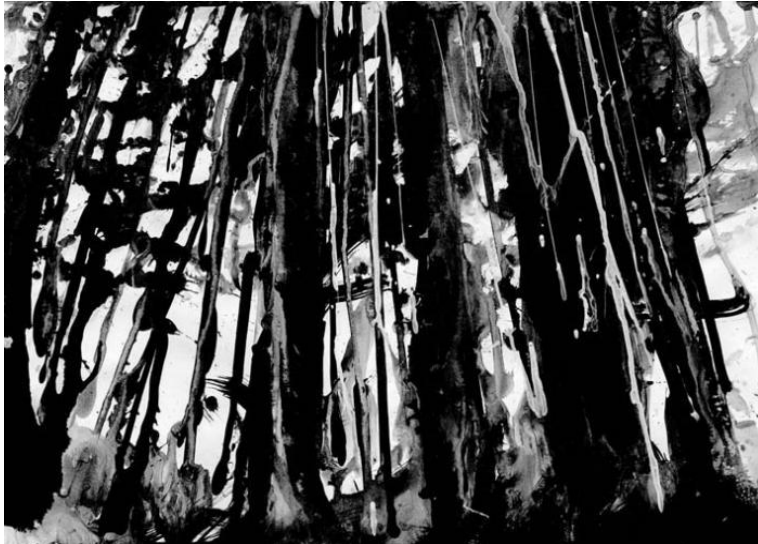
Manu Larcenet , « le bois la nuit », Encre, 2009