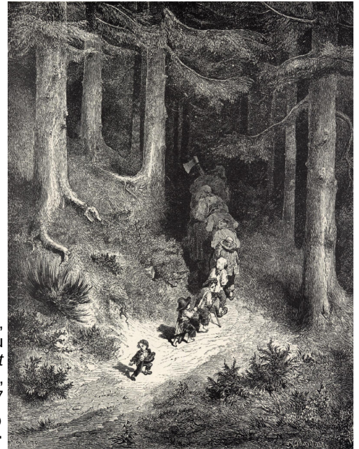
Gustave Doré, illustration du livre «le petit poucet», Gravure, 1867