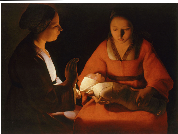
Georges de La Tour (1593-1652) , « Le Nouveau-né », peinture

Quelle a été la stratégie mise en place par l'artiste pour nous présenter une ambiance de Forêt la nuit ?