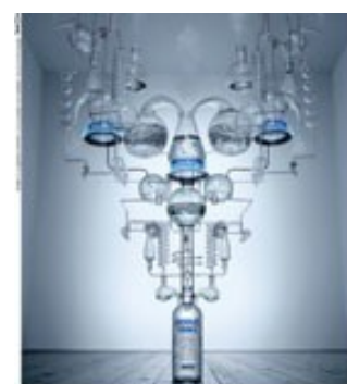
ABSOLUT PURETÉ Le Point d'Absolut est une d'une Distillation Continue