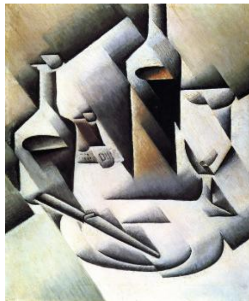
Juan GRIS, Plateau de fruit et bouteille d'eau , 1914, dimensions non référencées, Krüller-Muller museum GRIS, Bouteilles et couteau , 1911-12, huile sur toile, 54,6 x 46 cm, Krüller-Müller museum, Pays-Bas

La mimesis de la forme a été mise en question par le Cubisme. BRAQUE, PICASSO et GRIS se sont sentis libres de décomposer la forme pour la recomposer, par le montage, le collage ou la citation. Les signes hétérogènes, les formes et les motifs se sont combinés. L'original a perdu sa place primordiale au profit d'un nouveau rapport fond/forme. Le