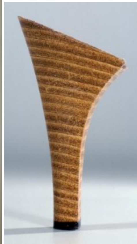
Patrick TOSANI, Cuillère en acier inoxydable , 1988, série et Talon de chaussure , réduction d'un objet à un élément représentatif, la partie suggérant le tout

TOSANI photographie le feu et la glace, de simples cuillères, des peaux de tambour, des ongles rongés, et les agrandit démesurément . Ses images s'imposent par leur taille et suscitent des sensations physiques. Il est fasciné par les qualités techniques de l'appareil photo : sa capacité à retenir les détails , à aplanir les espaces , à modifier les