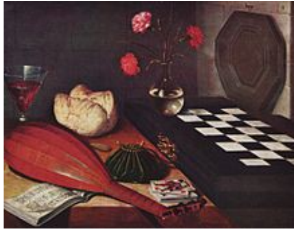
Lubin BAUGIN, Nature morte à l'échiquier , vers 1631, huile sur bois, 55x73 cm, Musée du Louvre, Paris

- « Vous êtes-vous autorisé à changer la forme de la bouteille d'eau ? ou êtes-vous resté dans une approche traditionnelle de la forme ? »