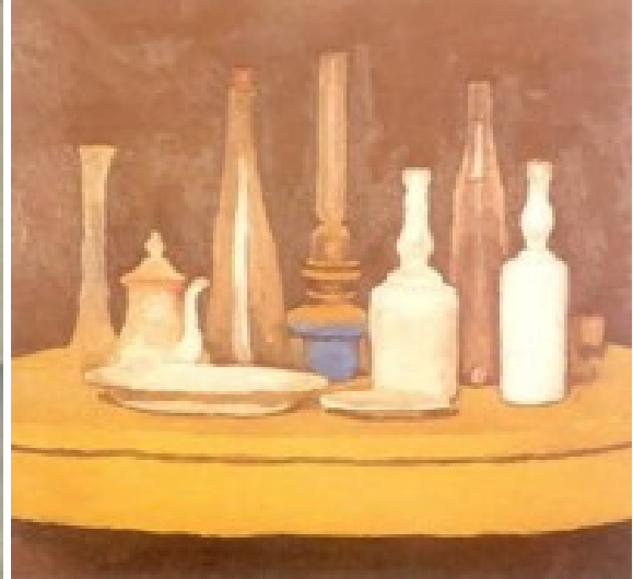
Giorgio MORANDI , Nature morte aux bouteilles , huile sur toile, 192 x 164 mm, 1957