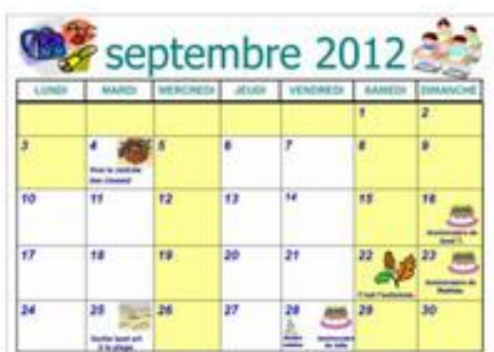
Calendrier papier (affiché)

Les 2 premières semaines, l'Ens barre les jours passés en expliquant la façon d'utiliser les outils du TBI et déplace l'icône « météo » dans la bonne case. Ensuite, c'est l'élève de service qui le fera : utiliser le crayon, choisir le trait droit, la couleur, déplacer une image (l'agrandir ou la réduire si besoin) et enregistrer le fichier.