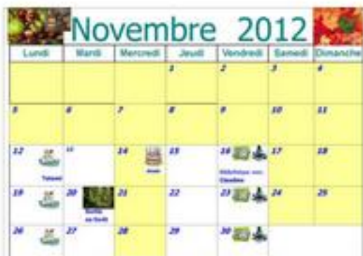
Calendrier papier et TBI

Les élèves auront aussi un calendrier « papier » à compléter de la même façon : jours + évènements à coller.