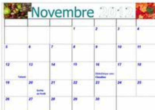
Calendrier individuel à compléter

Décembre : Découverte du calendrier à compléter collectivement. Cette fois, il faudra compléter les jours (déjà placés) en écrivant la première lettre en majuscule + colorier les jours sans école + placer les évènements toujours en fonction des indices donnés verbalement ou déjà écrits.