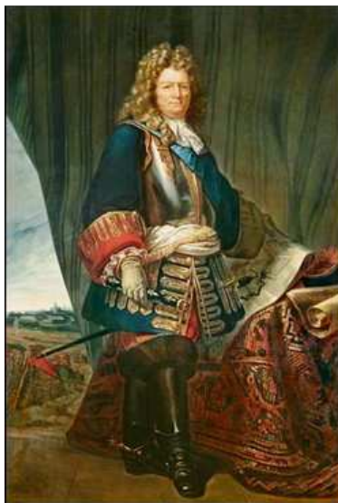
Le Génie, « une intelligence du territoire »

Document réalisé par les responsables du musée du Génie et le professeur référent.