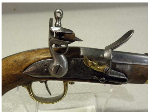
platine d'arme à feu