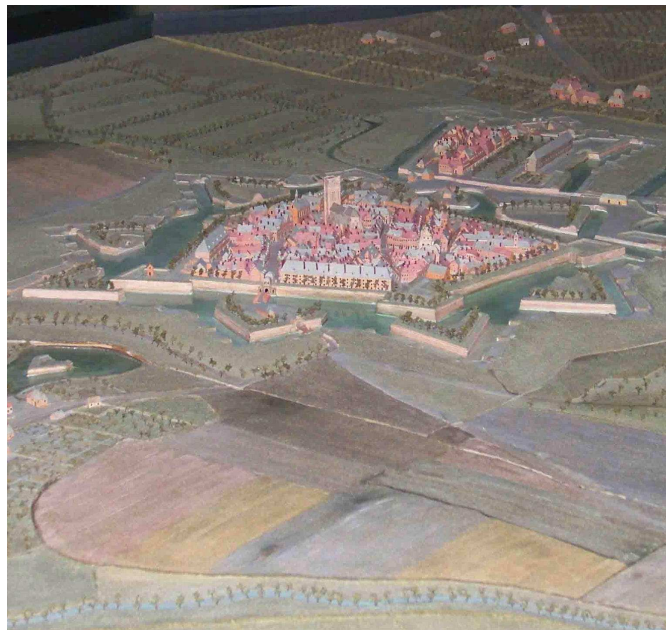
Plan-relief animé de Landrecies, place forte du « pré carré » de Vauban