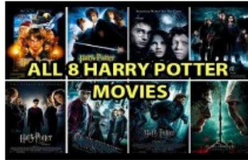
Author JK Rowling - film

Les images ci-dessous sont justes pour t'inspirer. Tu n'es pas obligé(e) de les choisir.