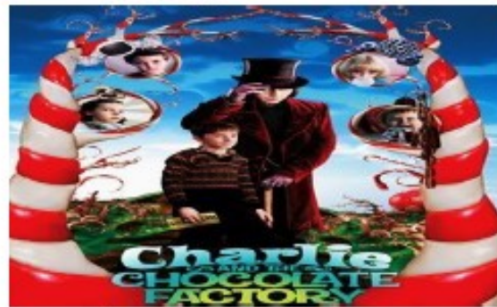
author Roald Dahl