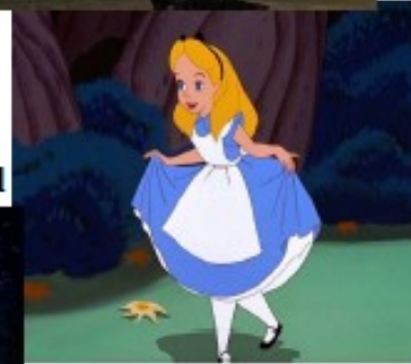
author Lewis Carol