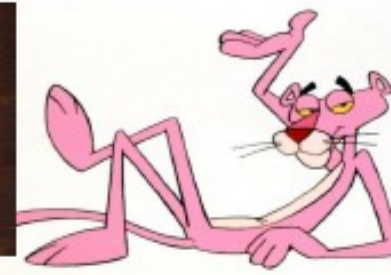
Peter Sellers – The Pink Panther cartoon