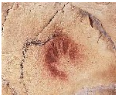
1. Main de Chauvet – art pariétal 25 000ans avant J.C

A ton avis, comment ont été réalisées ces peintures ? Quels outils ont-ils bien pu être utilisés ? Quels gestes ont été faits ?