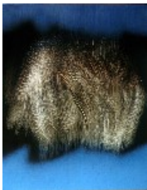
5. Hans Hartung