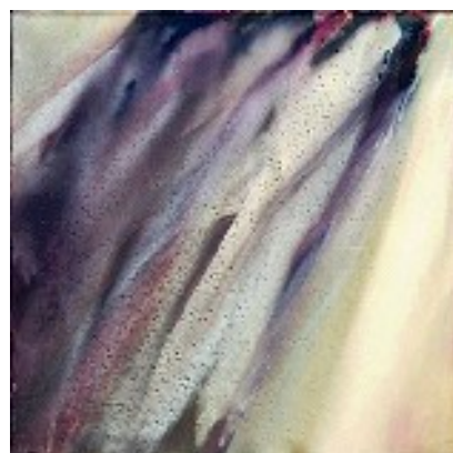
6. Olivier Debré