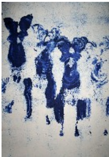
2. Yves Klein