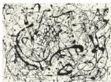
4. Jackson Pollock