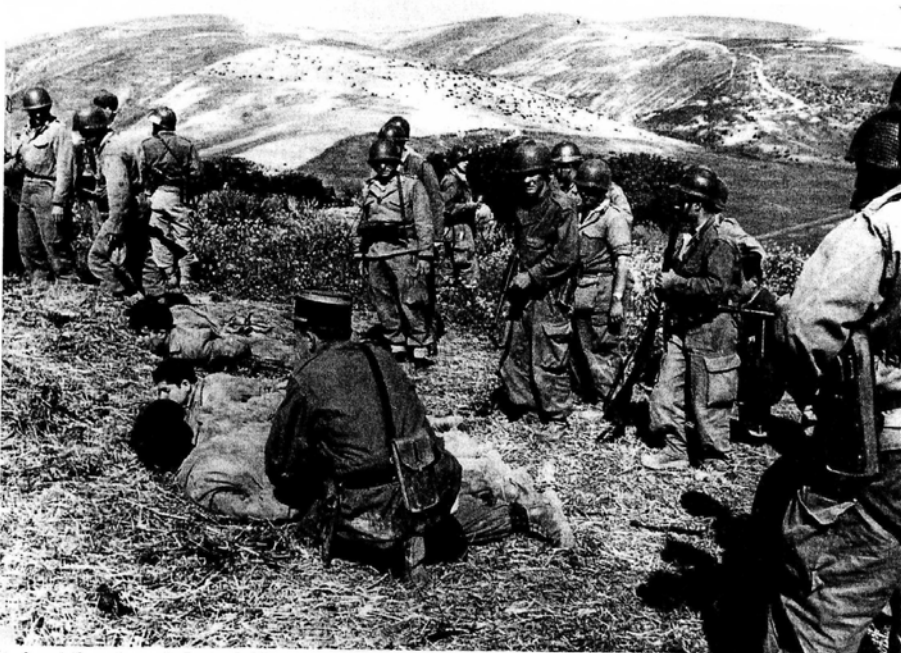
Arrestations de combattants algériens en Oranie lors d'une « opération de maintien de l'ordre », 10 mai 1958. L'expression « guerre » d'Algérie n'est devenue officielle que le 18 octobre 1999.