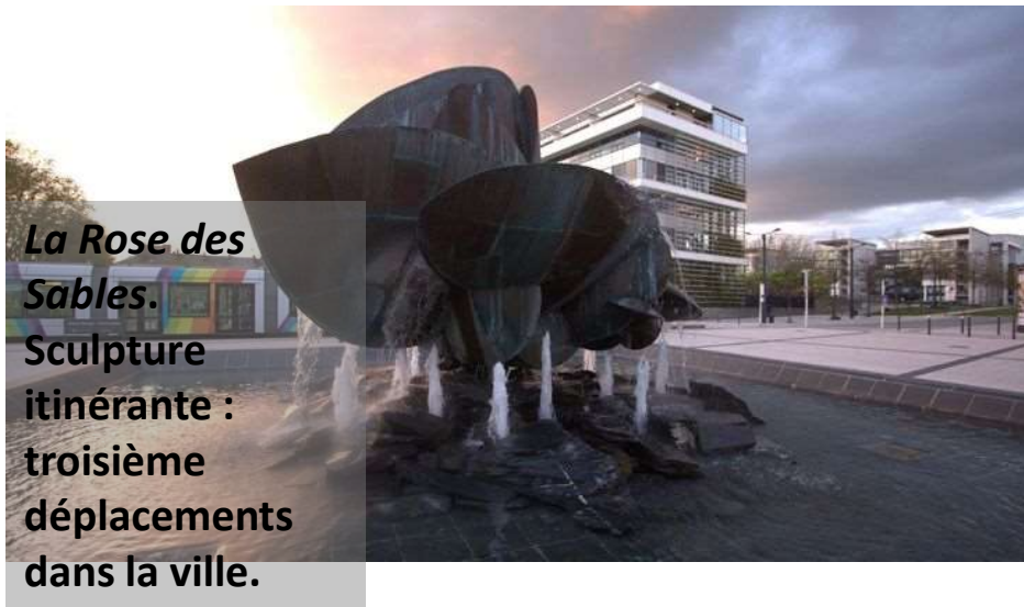
La Rose des Sables. Sculpture itinérante : troisième déplacements dans la ville.