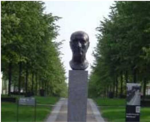
Buste de François Mitterrand Granit et bronze : matériaux de la commémoration Echelle humaine et faible mise à distance (au sol) Seule la référence au buste romain évoque le statut de l'homme d'Etat.