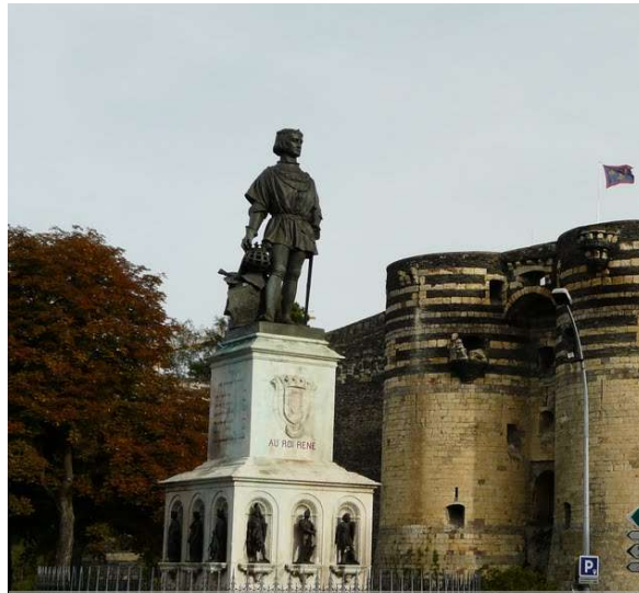
Statue du Roi René. Le socle monumental et la situation urbaine rendent l'effigie inaccessible. L'importance historique du personnage pour la ville est accentuée par le dialogue avec le château.