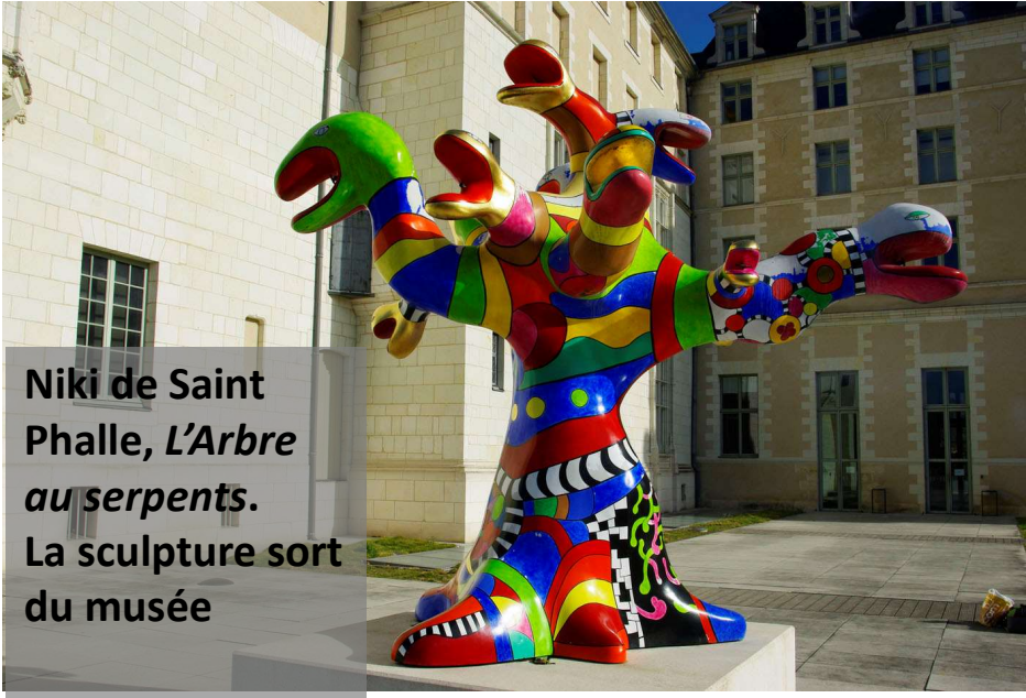
Niki de Saint Phalle, L'Arbre au serpents . La sculpture sort du musée