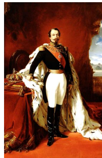
Franz Xaver Winterhalter, peinture, 1855.