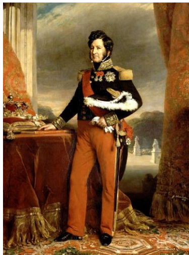
Franz Xaver Winterhalter, peinture, 1839.