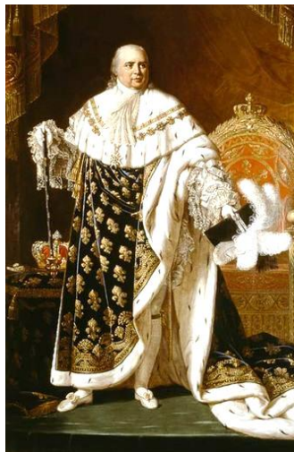
Robert Lefèvre, peinture, 1822.