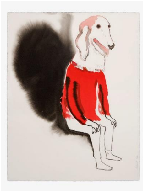
F. PÉTROVITCH, Hybride, 2020, lavis d'encre sur papier, 50 x 40 cm