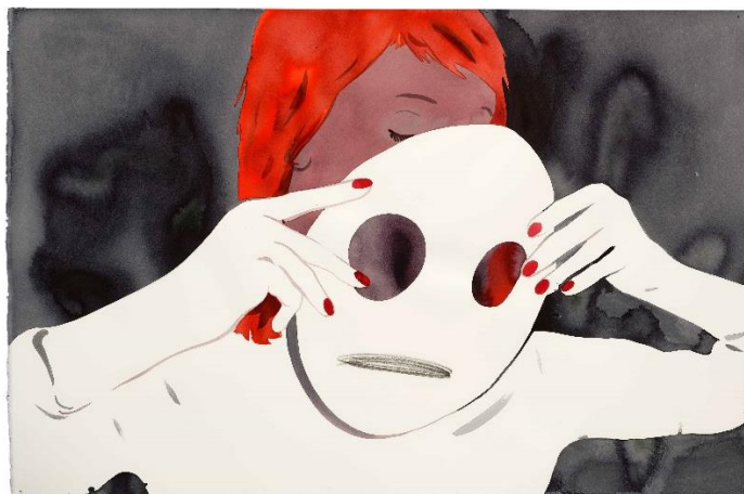
F. PÉTROVITCH, Sans titre, 2022, lavis d'encre sur papier, 120 x 80 cm