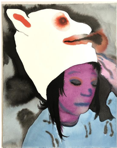
F. PÉTROVITCH, Sans titre, 2022, lavis d'encre sur papier, 50 x 40 cm

« Je propose un bloc d'images, je ne veux pas d'histoire qui se referme. Si on dit tout, il n'y a plus rien à penser...C'est un mélange de choses vues, vécues, imaginées, transformées. » Françoise PÉTROVITCH.