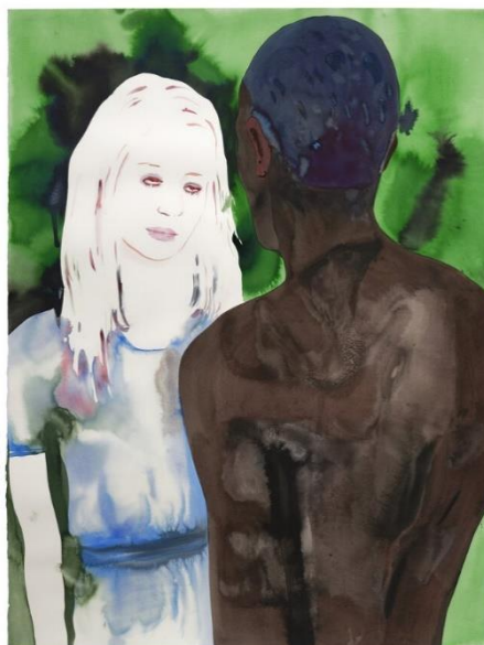
F. PÉTROVITCH, Sans titre, 2020, lavis d'encre sur papier 161 x 120 cm