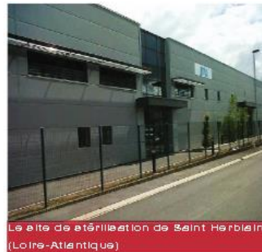
Le site de stérilisation de Saint Herblain (Loire-Atlantique)

1) Nom, fonction et missions de la personne qui dirige la visite du groupe :