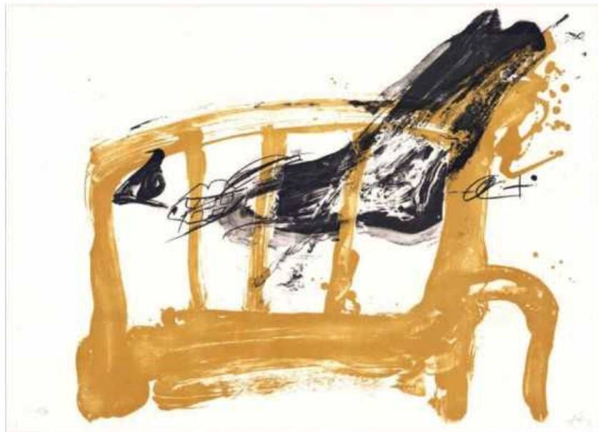
Antoni Tàpies, Variations II : Chaise et pied (1983), Litografía, 75 x 108 cm