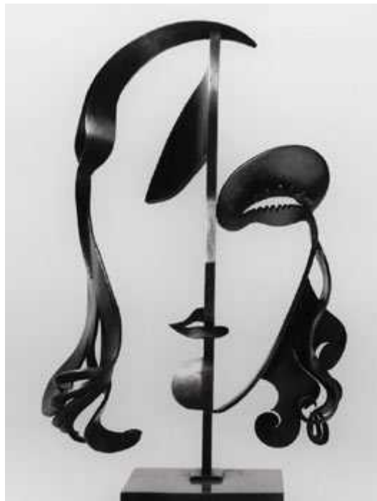
Pablo Gargallo, Greta Garbo con pestañas , (1930)