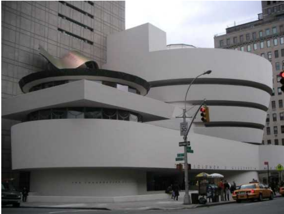
Frank Lloyd Wright, Museo Salomon Guggenheim , New York (1959)