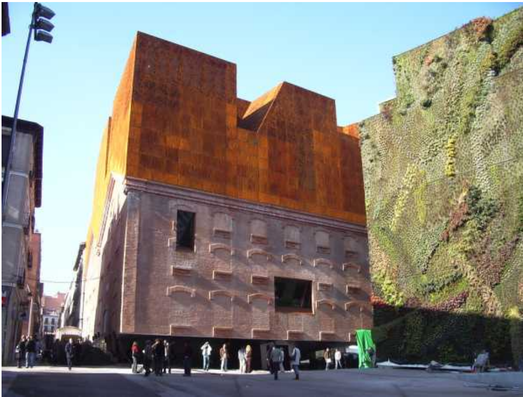
Herzog & De Meuron, Caixa Forum , Madrid (2008)