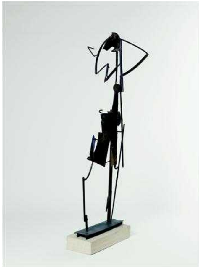
Julio González, Femme se coiffant I , (1931), Centre Georges Pompidou, Paris