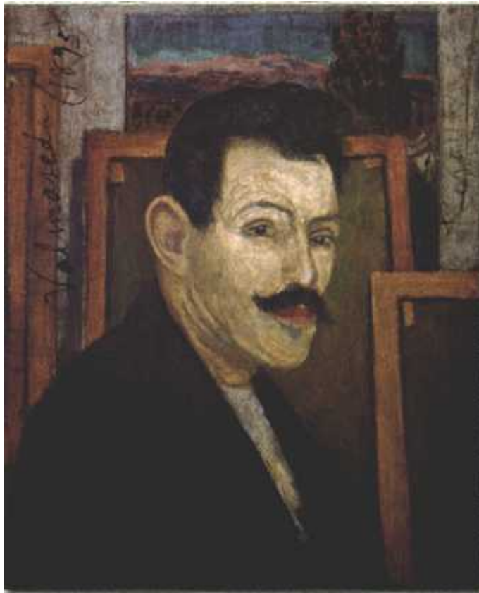
Darío de Regoyos Autorretrato (1895), Óleo/tabla, Museo de BB. AA. de Asturias