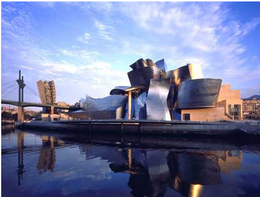
Frank Gehry, Museo Guggenheim , Bilbao (1997)