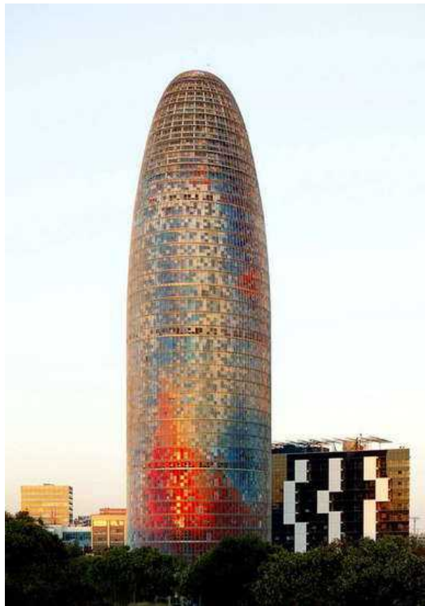
Jean Nouvel, Torre Agbar , Barcelona (2005)