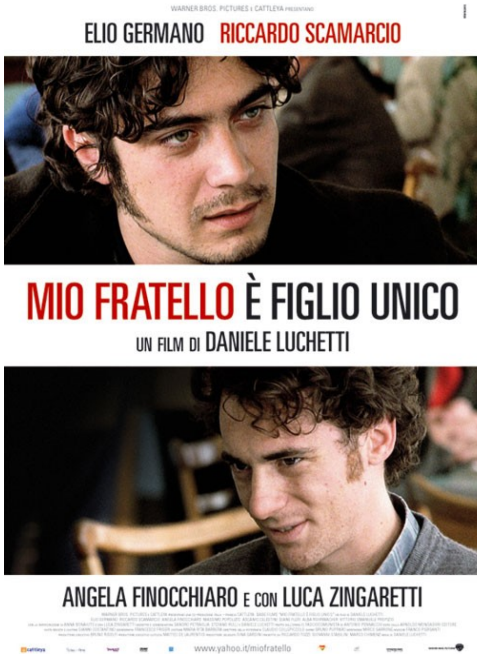
La locandina italiana