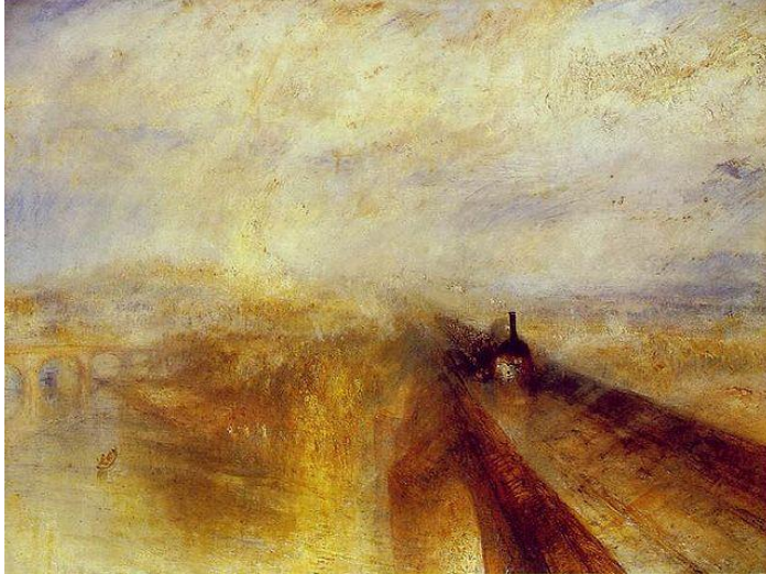
Pluie, Vapeur et Vitesse - Le Grand Chemin de Fer de l'Ouest, ou en anglais Rain, Steam and Speed - The Great Western Railway, 1844 William Turner (1775-1851)

Le motif de la gare ou du chemin de fer dans la peinture :