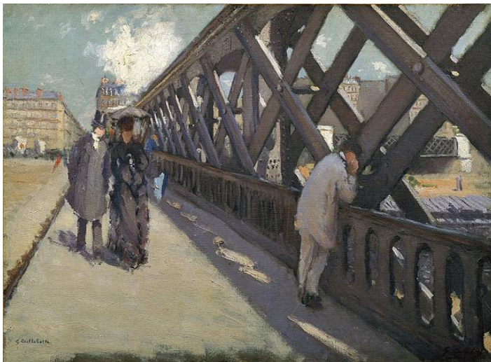
Le Pont de l'Europe, Gustave Caillebotte. 1876

(Le travail de Turner a beaucoup influencé les impressionnistes)