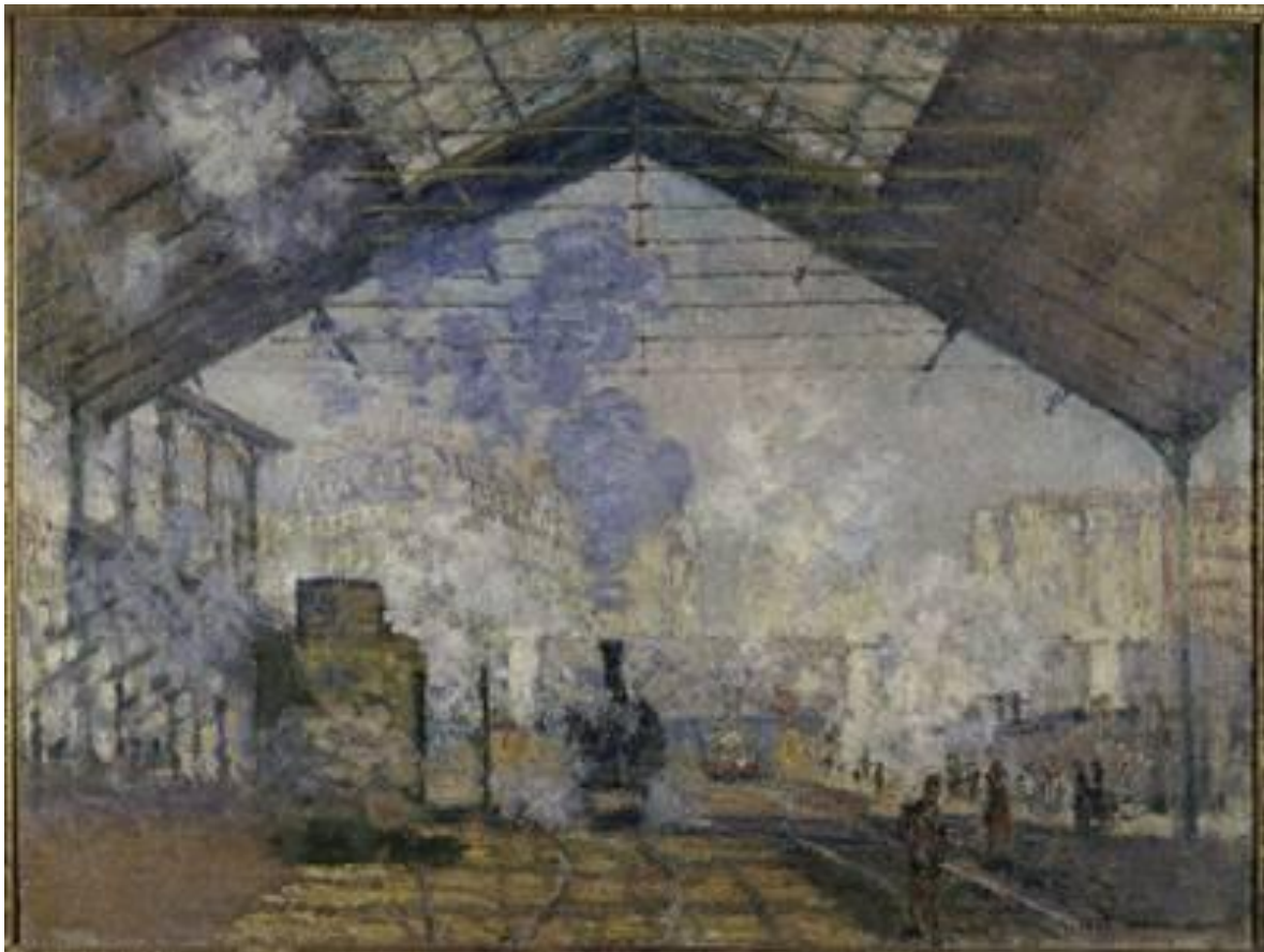
La Gare Saint-Lazare, Claude Monet, 1877.

En janvier 1877, Claude Monet s'installe près de la gare Saint-Lazare. Désireux de s'atteler à un sujet résolument moderne et urbain, le peintre obtient l'autorisation officielle de dresser son chevalet à l'intérieur de la gare. Monet saisit sur le vif l'atmosphère bouillonnante qui, tour à tour, estompe ou souligne la charpente métallique et la verrière de la marquise, le tracé des voies, les façades des immeubles, les silhouettes. Par une palette riche et une touche variée, le peintre fixe les " impressions " que lui inspirent les jeux multiples de lumière et de couleurs entre le soleil et la vapeur. Ce tableau regroupe tous les aspects de la modernité et de la problématique impressionniste : peindre «sur le motif », la présence de la touche du pinceau, peindre en série (le même sujet peint plusieurs fois), le travail de la lumière et des couleurs de l'eau sous toutes ses formes, la modernité du sujet.